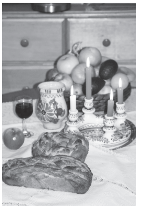
Jó tavasz, őszt, telet, nyárt, jó termést és jó vásárt ez új esztendőben

1848. január 3-án a felvidéki Videfálván megalakult a Magyarhoni Földtani Társaság . Alapvető feladatának tartotta, többek kö-